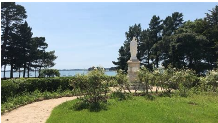
Au centre spirituel de Penboc'h (Morbihan)