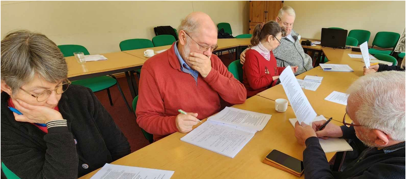
Travail en sous-groupe.