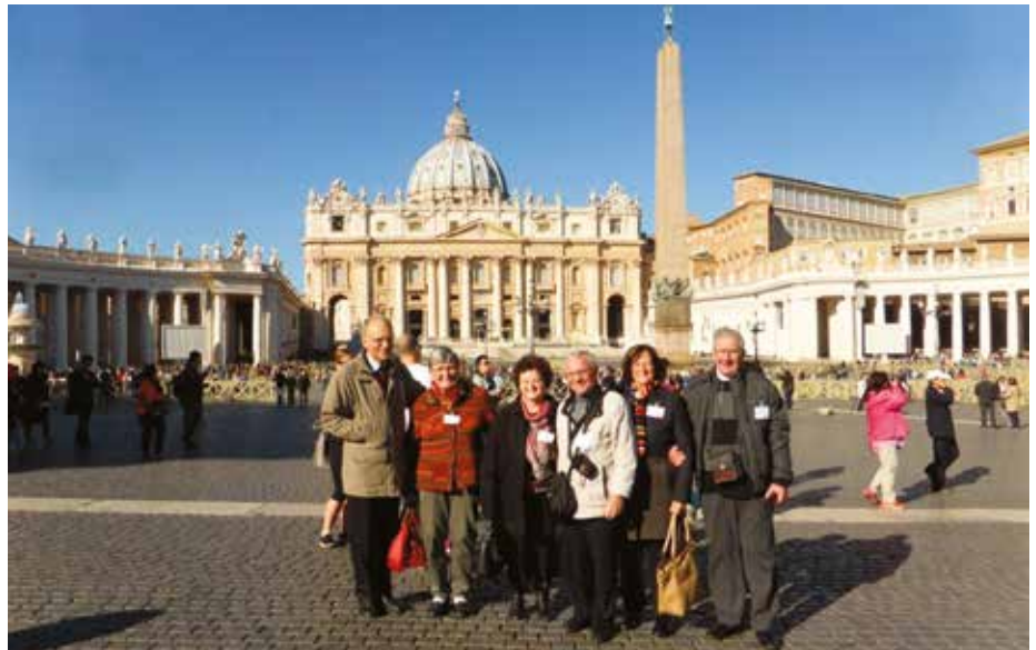
Trois des diacres français et leurs épouses

Rendez-vous nous a été donné en septembre 2017 pour la prochaine rencontre internationale peut-être à ... Strasbourg.