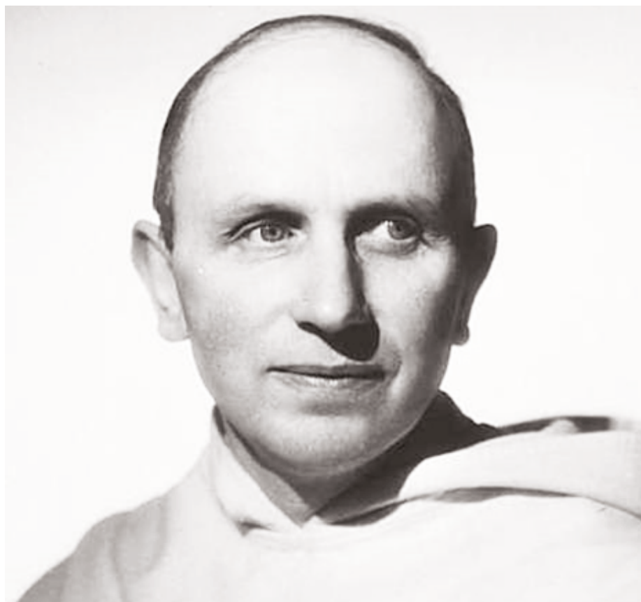
P. Yves Congar

Issu d'une ville de religion mixte, Yves Congar a toujours gardé le réflexe d'aller vers les protestants. Si bien que, dans les années 1930, suivre les cours de la Faculté libre de théologie de Paris lui semble nécessaire pour vivre sa vocation. Ses supérieurs le laissent faire, même si certains voient sa démarche comme un risque pour la foi. Du côté protestant, l'arrivée de ce moine en soutane a dû en surprendre plus d'un. Lorsque le théologien réformé Karl Barth vient pour la première fois à Paris, Congar n'hésite pas à l'inviter aux éditions du Cerf, pour prendre un