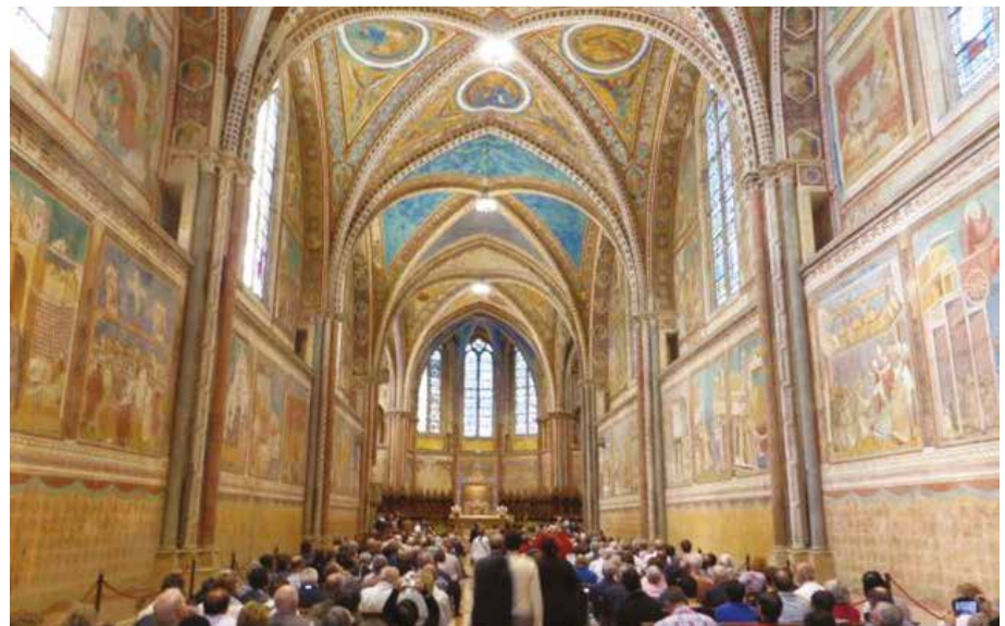
Eucharistie à la Basilique d'Assise

Une belle cérémonie de remise de prix A l'occasion de ce 50e anniversaire, en coopération avec la fondation "Diaconia Christi Internationalis", le CID / IDZ a évalué plusieurs projets de di-