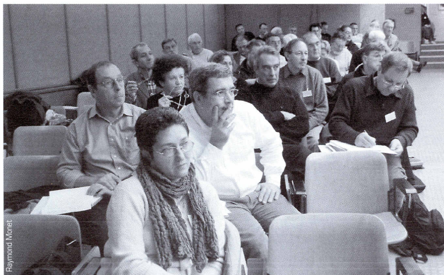
▀ Les diacres, un ensemble social « unique et nouveau ».

La modernisation culturelle est ici entendue comme la posture d'autonomie du sujet, telle que des courants contemporains la conçoivent. Ainsi les diacres, selon cette analyse, parce que la majorité d'entre eux reste attachée à un catholicisme identitaire et intégraliste, et reste déférente envers les références épiscopales, résistent de façon mesurée à la modernisation culturelle. Dans le même ordre d'idées, même si une minorité d'entre eux demandent des modifications pour les ministères, les diacres sont d'accord pour confirmer les prêtres dans leur rôle ministériel. ▀